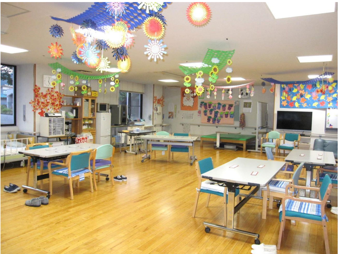
ご利用者と四季に合わせた壁画を作成しています。