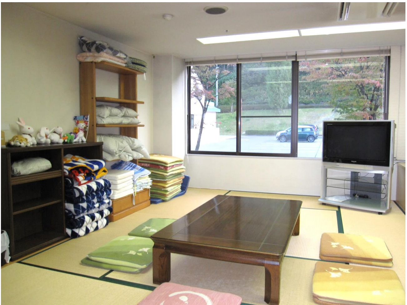
大きな窓からは、四季折々の風景が楽しめます。